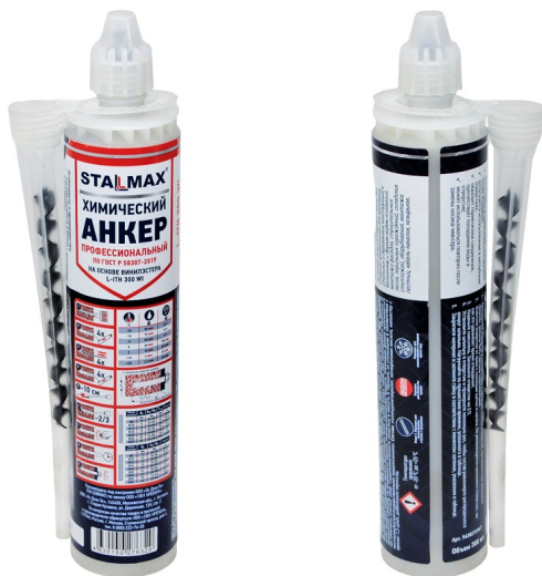
Фото изделия и таблица по отверждению